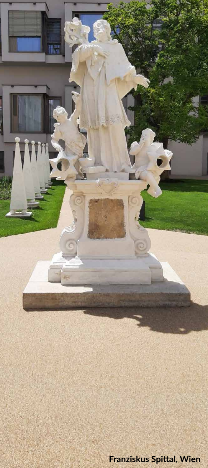
Franziskus Spittal, Wien