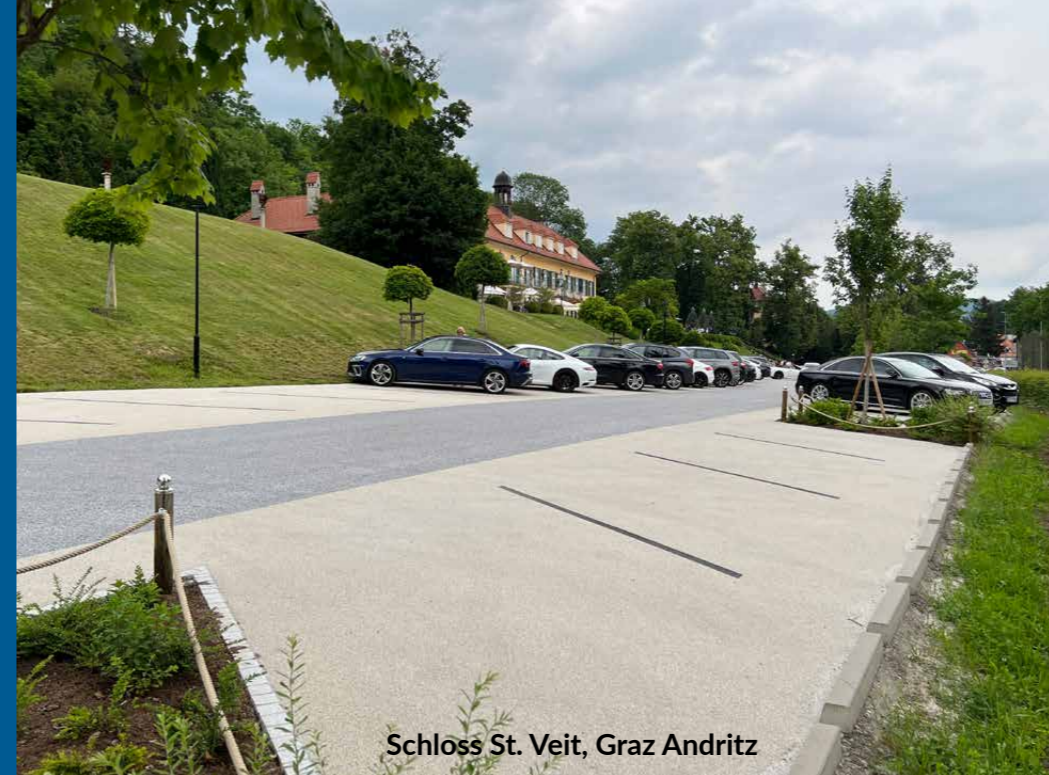
Schloss St. Veit, Graz Andritz