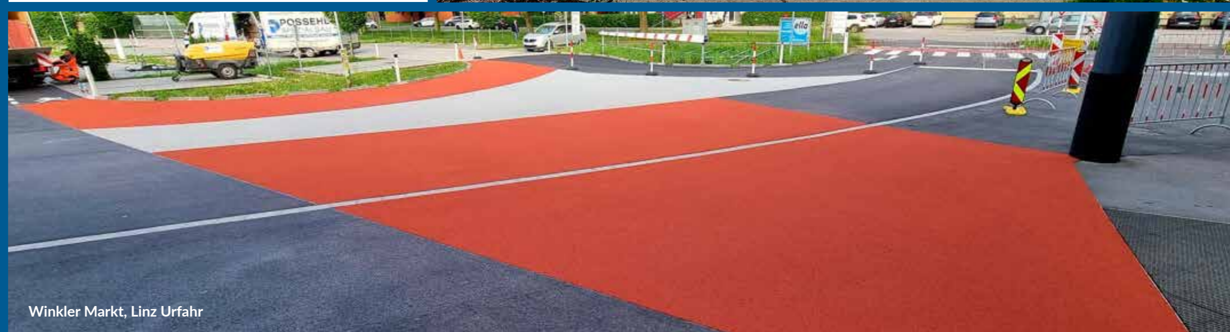
Winkler Markt, Linz Urfahr