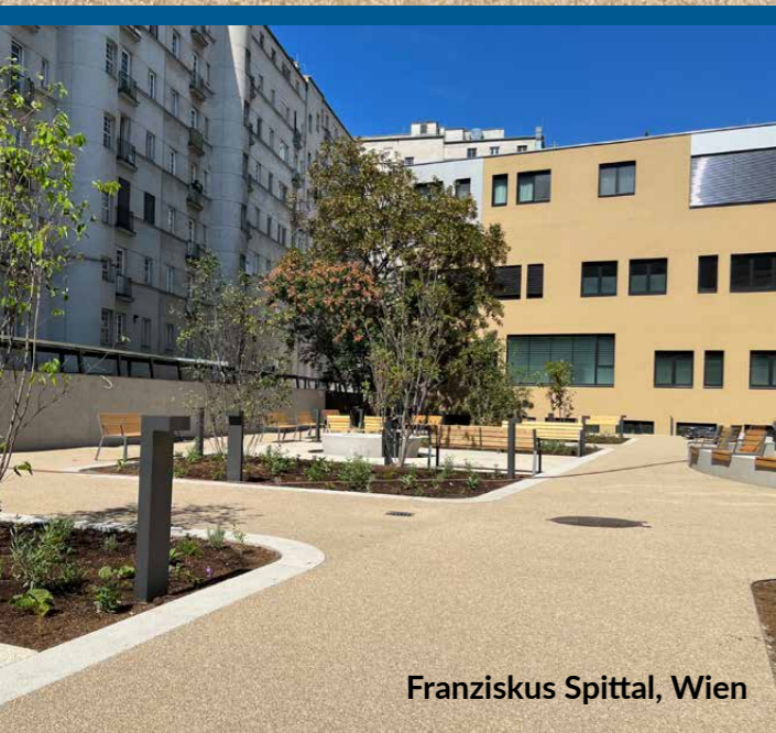
Franziskus Spittal, Wien